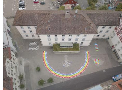
Schulhaus Kirchplatz (Kirchgasse 19)