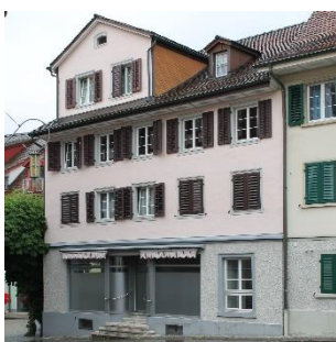
Schulraum (Kirchgasse 10)