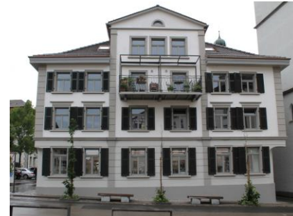
Haus Harmonie (Kirchgasse 21)