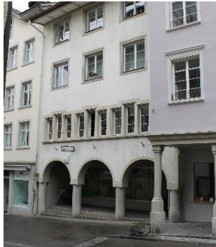
Haus zur Taube (Marktgasse 44)