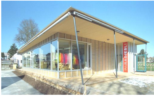
Kindergarten Paradiesli (Haldenstrasse 12)