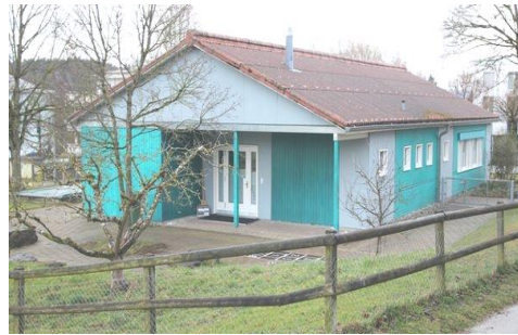
Kindergarten Städeli (Langeeggstrasse 28)