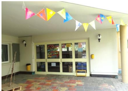
Kindergarten Neualtwil (Grundgasse 1A)