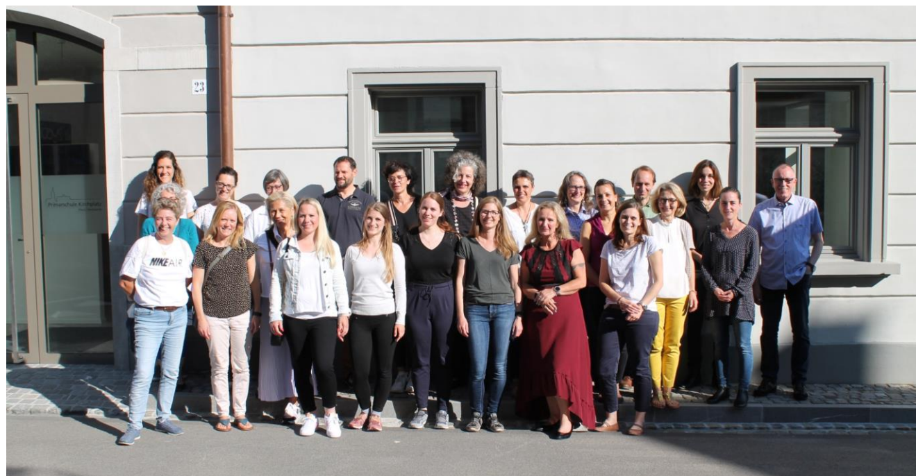
Teamfoto vor den neuen Schulräumen im Haus Harmonie