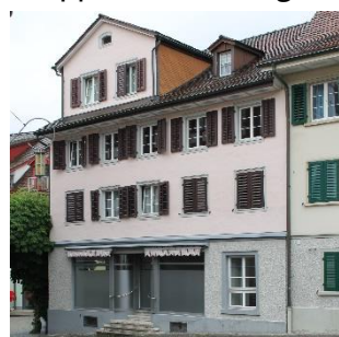
Gruppenraum Kirchgasse 10